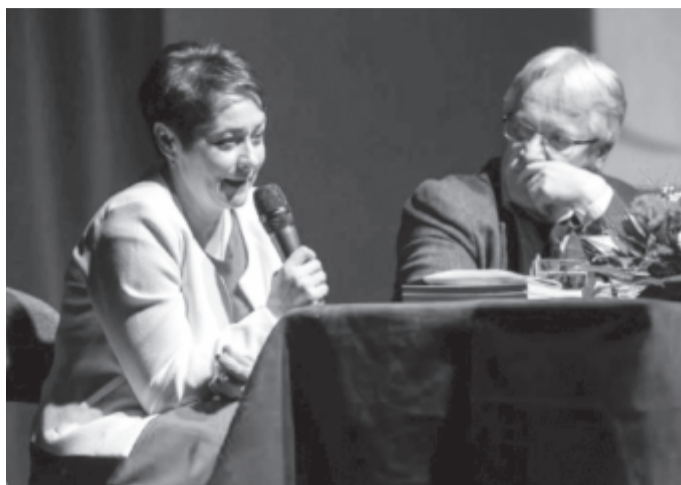
A négyszeres olimpiai bajnok tornász Szabó Katalin (b) és életregényének írója, Csinta Samu a budapesti könyvbemutatón.

Szabó Katalin – aki 1983-ban, 15 évesen aranyérmet nyert talajon a budapesti világbajnokságon – elárulta, már évek óta foglalkoztatta, hogy könyv készüljön a pályafutásáról, de korábban nem volt megfelelően felkészülve lelkileg, hogy meséljen az életéről. „Ezt a kötetet édesanyámnak ajánlom. Ha ő nincs, nem lettem volna tornász, nem lettem volna az az ember, aki ma vagyok, ilyen kemény, erős és ambiciózus” – mondta. Hozzáfűzte, a könyv egyfajta gyógyszer a számára, mert sok dolgot kimondhatott, amire korábban nem volt lehetősége.