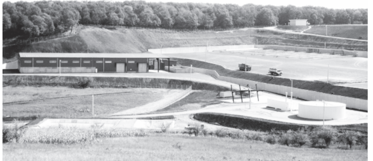
A kerelősztentpáli mechanikai-biológia kezelőállomás