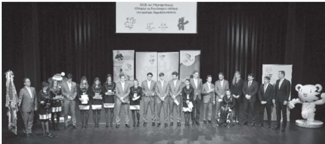
A február 9-én kezdődő phjongcsanghi téli olimpiára és a március 9-én rajtoló téli paralimpiára utazó magyar csapat eskütétele a budapesti MOM Kulturális Központban 2018. január 22-én.

Letette az esküt a február 9-én kezdődő phjongcsanghi téli olimpiára és a március 9-én rajtoló téli paralimpiára utazó magyar csapat.