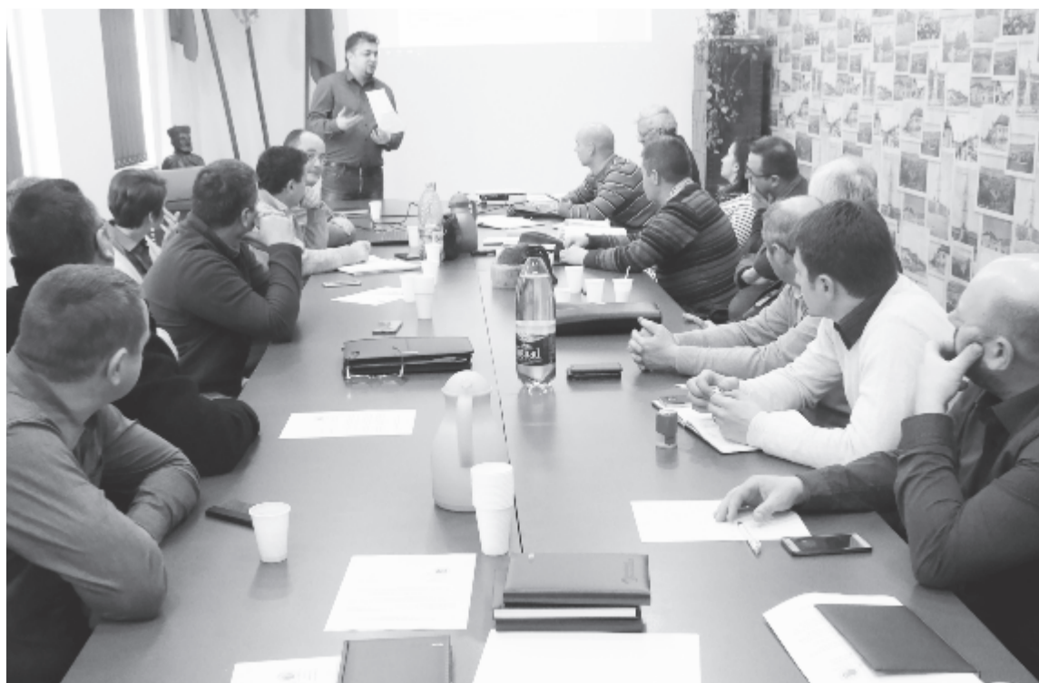
A néhány nap múlva megnyitott lehetőségekről tájékoztatták a közgyűlést